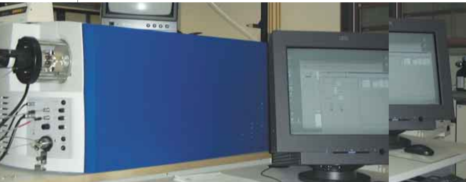
Spectromètre de masse (SM).

Les chimistes analytiques de l'Institut de Chimie Organique et Analytique (ICOA) (UMR 6005 CNRS / Université d'Orléans) d'Orléans développent actuellement une nouvelle méthode d'analyse permettant le dosage d'acides aminés présents à l'état de traces dans des mélanges complexes d'origine diverse. En limitant le nombre d'étapes de préparation des échantillons à analyser, cette technique est non seulement rapide, mais aussi fiable, spécifique et sensible.