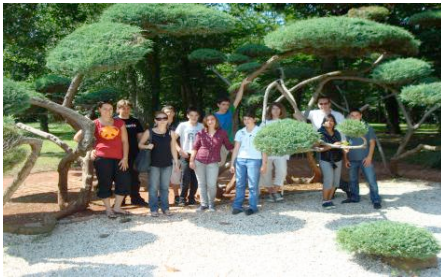
Visite du Parc Floral de la Source