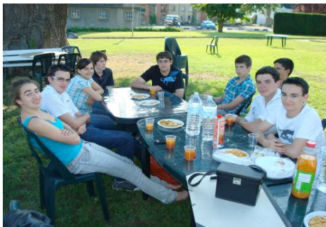
Goûter à l'ombre du Cèdre de l'IUFM

Un stage d'une semaine entièrement gratuit, ouvert à tous les