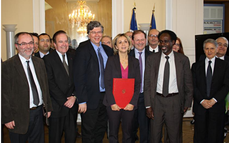
Les acteurs du PRES Centre - Val de Loire Université

Ancrée dans le territoire, ouverte à l'international Rooted in the region, open to the international world