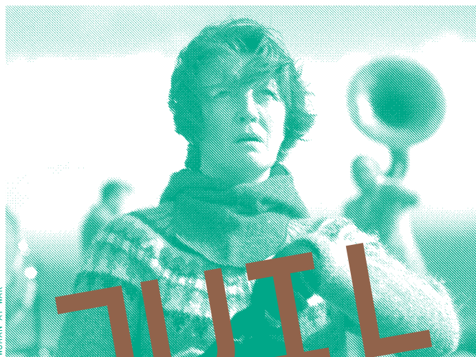
WOMAN AT WAR