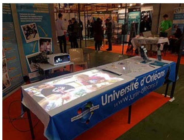
Tableau interactif de sol présenté au salon de Bourges

Que vous soyez enseignants ou étudiants dans nos centres de formation, n'hésitez pas à contacter votre responsable de centre pour assurer des présences et participer ainsi à la promotion de l'ESPE !