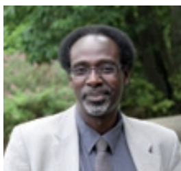
Youssoufi Touré Président de l'université d'Orléans