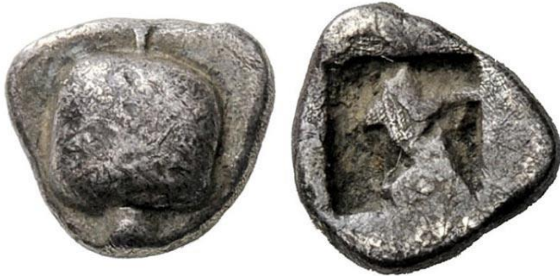
Monnaie 2A, droit et revers

Groupe de documents n°2. Composez un commentaire (environ 200 mots) à partir des documents proposés (2A et 2B).