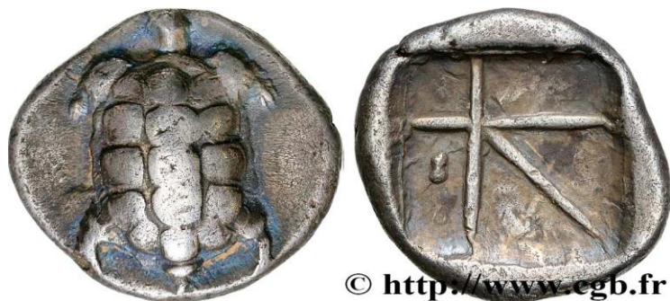
Monnaie 3A, droit et revers

Groupe de documents n°3. Composez un commentaire (environ 300 mots) à partir des documents proposés (3A, 3B, 3C), que vous décrirez et dont vous proposerez un classement chronologique.