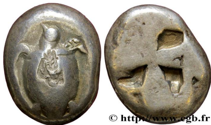
Monnaie 3B, droit et revers