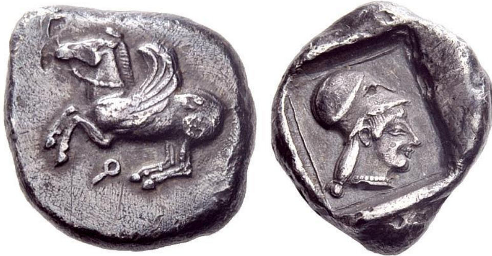
Monnaie 1A, droit et revers

Groupe de documents n°1. Composez un commentaire (environ 200 mots) à partir des documents proposés (1A et 1B).