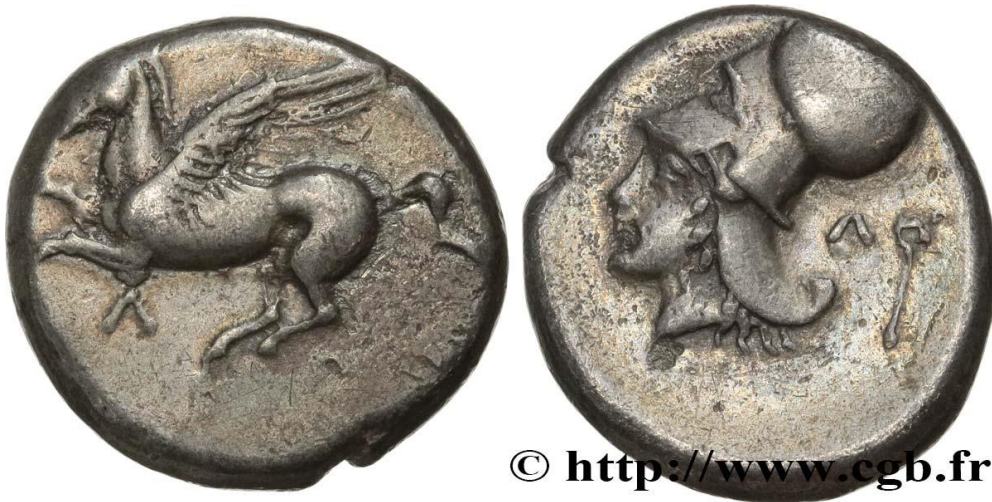
Monnaie 1B, droit et revers