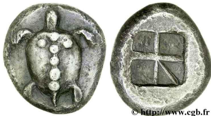
Monnaie 3C, droit et revers