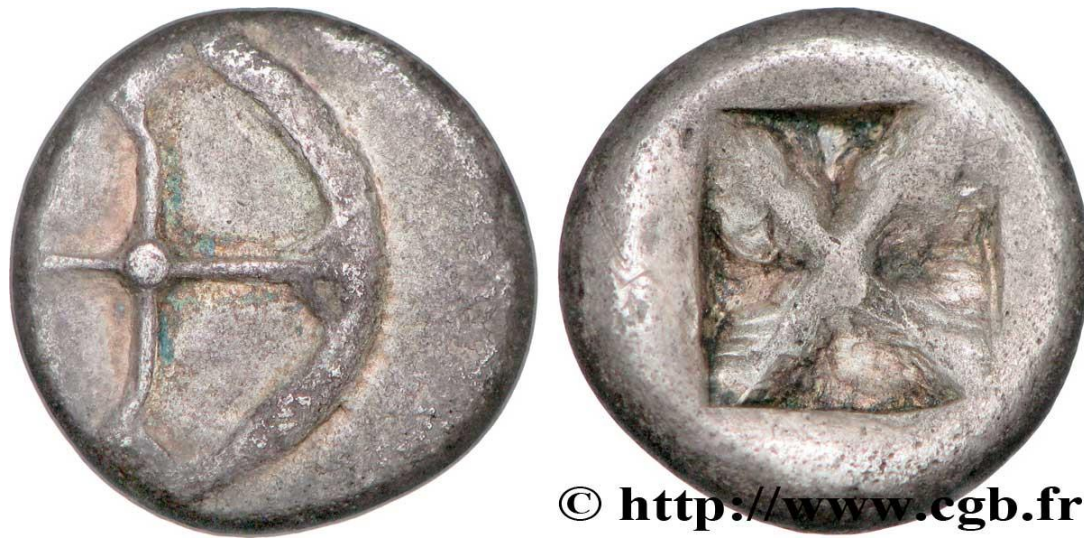
Monnaie 2B, droit et revers