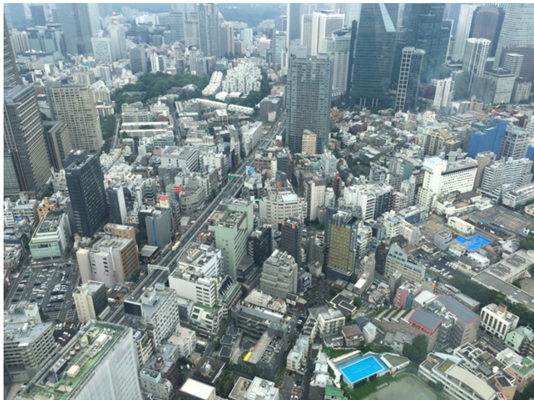
Tokyo, vu de la tour Mori, juillet 2019