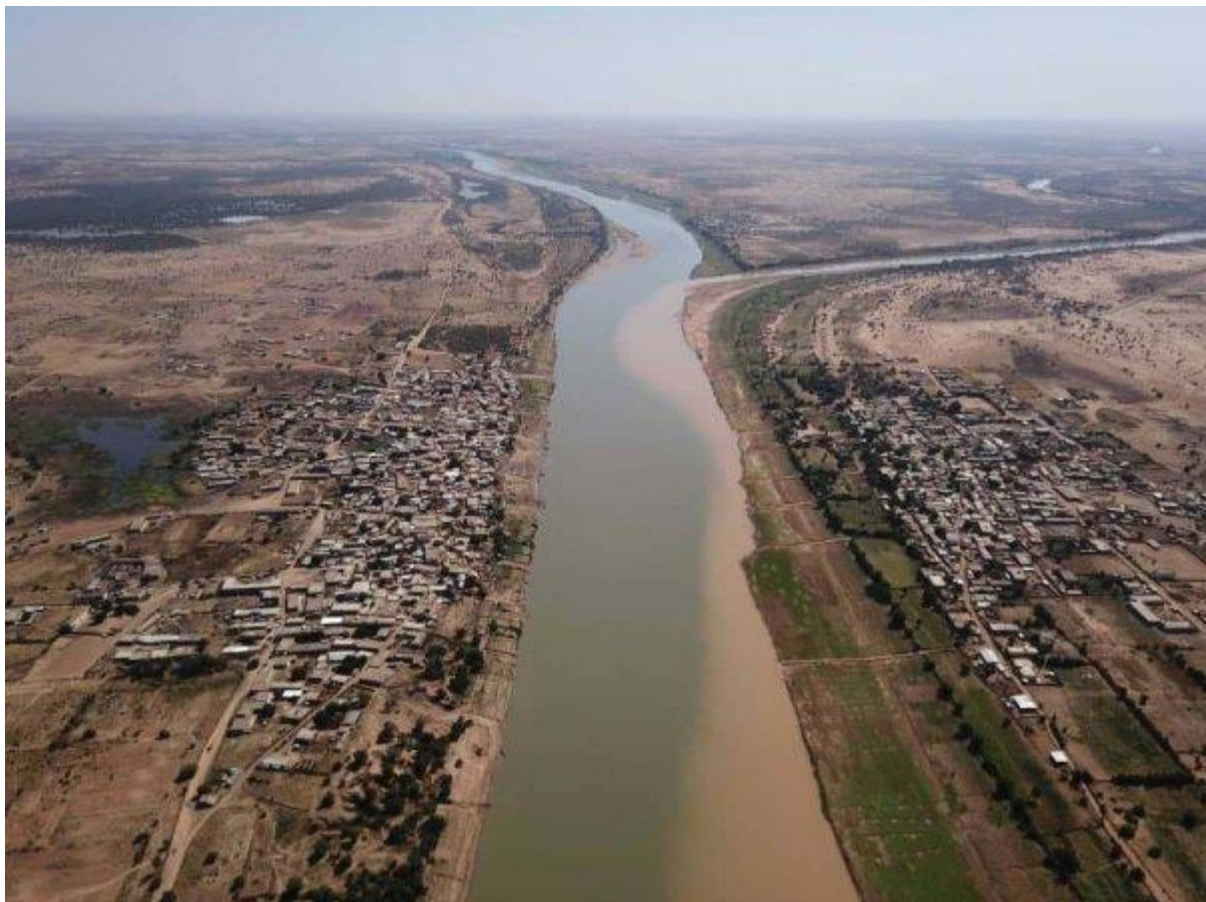
Document 2 : la moyenne vallée du fleuve Sénégal