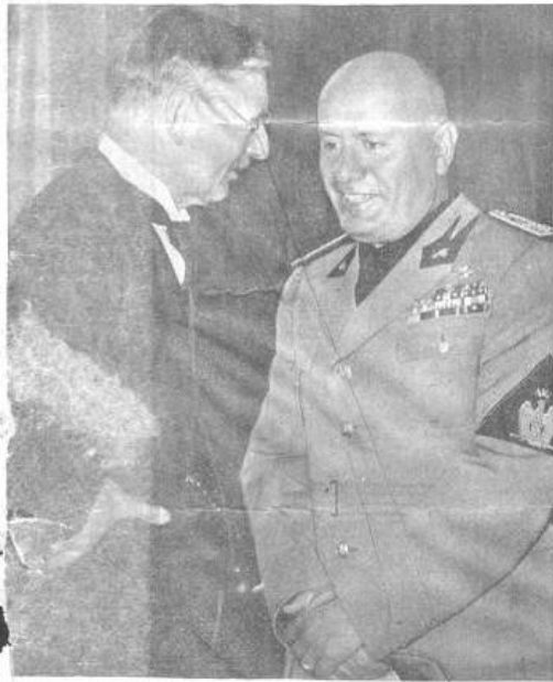
Les mains sur les hanches, M. Neville Chamberlain s'entretient avec M. Mussolini, lequel paraît très optimiste...

POUR OFFRIR A M. NEVILLE CHAMBERLAIN « LA MAISON DE LA PAIX » EN FRANCE « Paris-soir » ouvre une souscription nationale