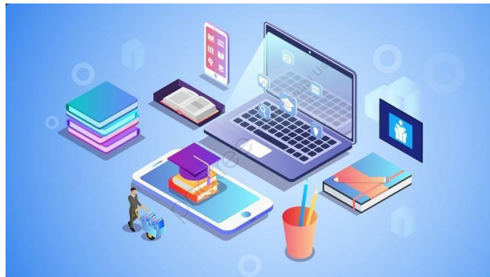
Illustration optionnelle à adapter éventuellement ci-dessus

Présenté et soutenu par : Prénom NOM de l'étudiant(e) Directeur/Directrice de mémoire : Prénom NOM (directeur/tuteur) Pour obtenir le grade de Master (BAC+5) Date : Le ___ / ___ / ___, à Orléans.