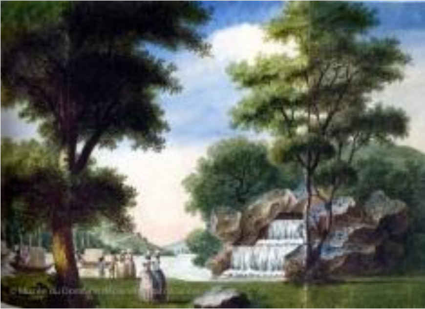
Carmontelle, Les quatre saisons