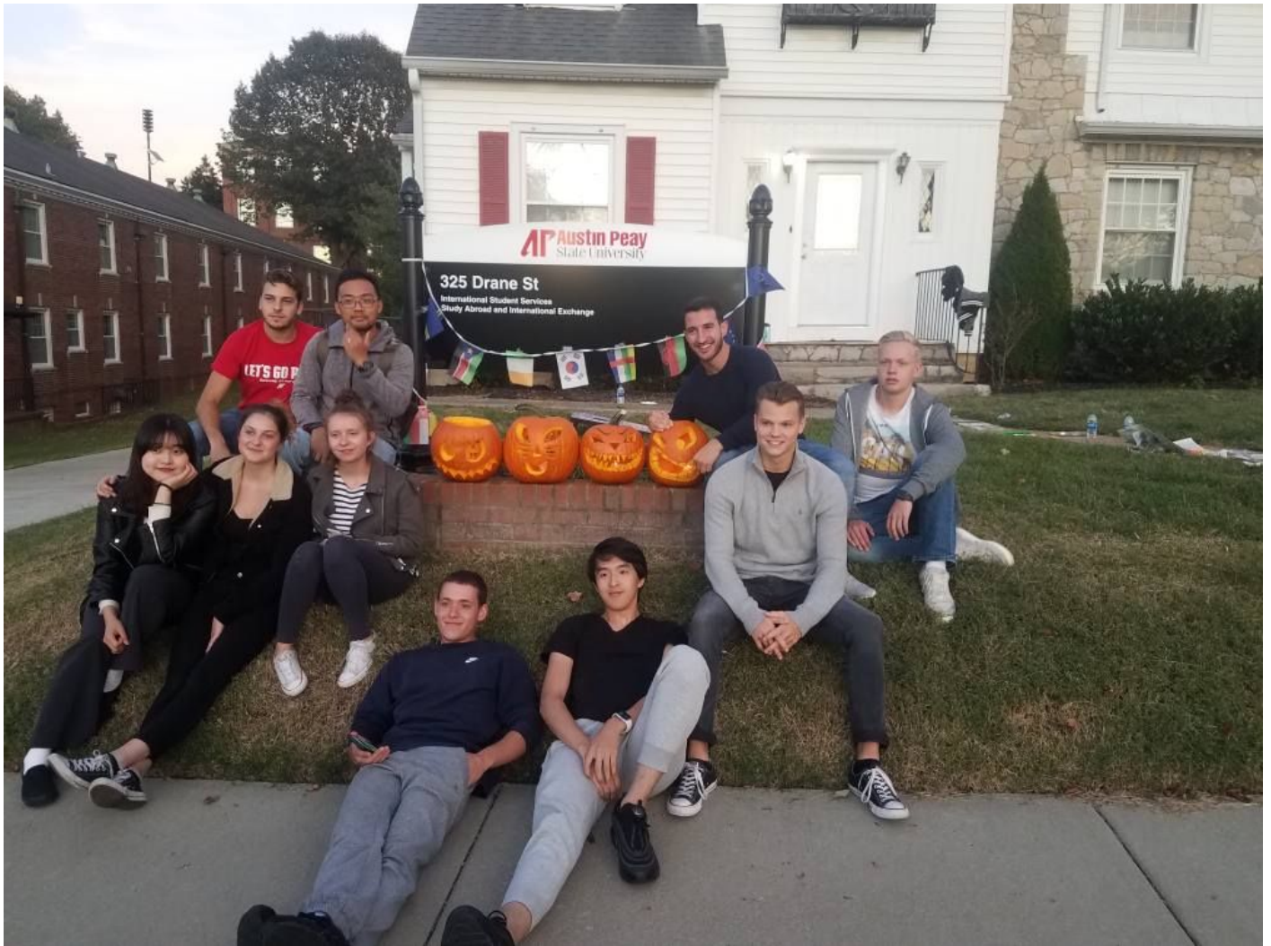
Les échanges d'Austin Peay 2019 (devant la White House)