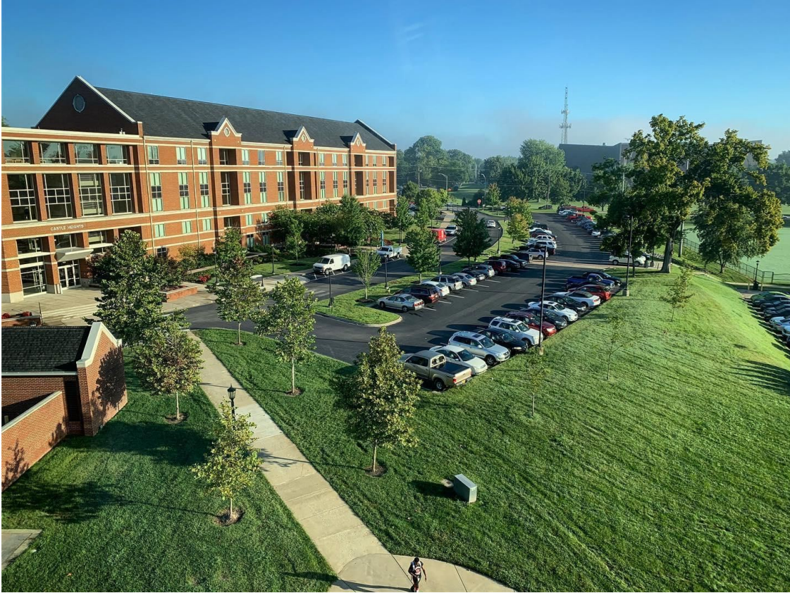
Campus de l'Université