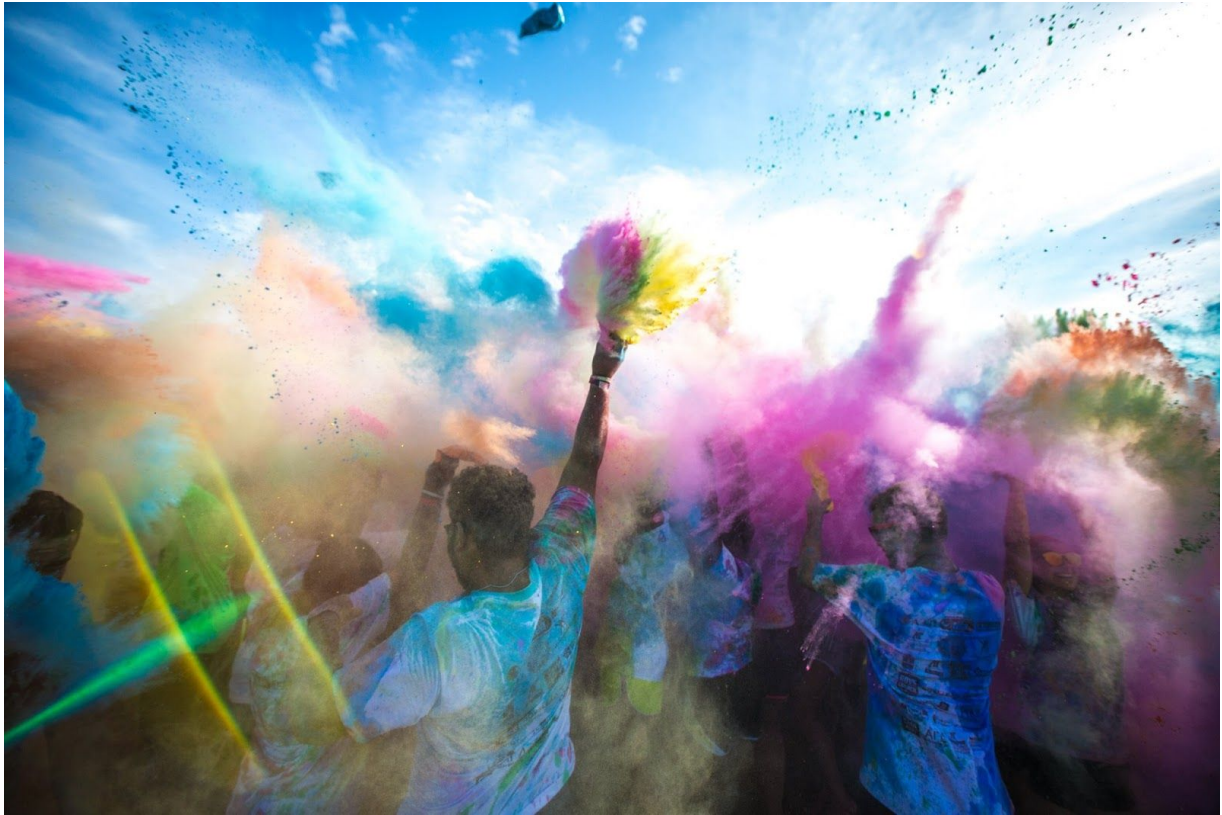
Color Gov Run