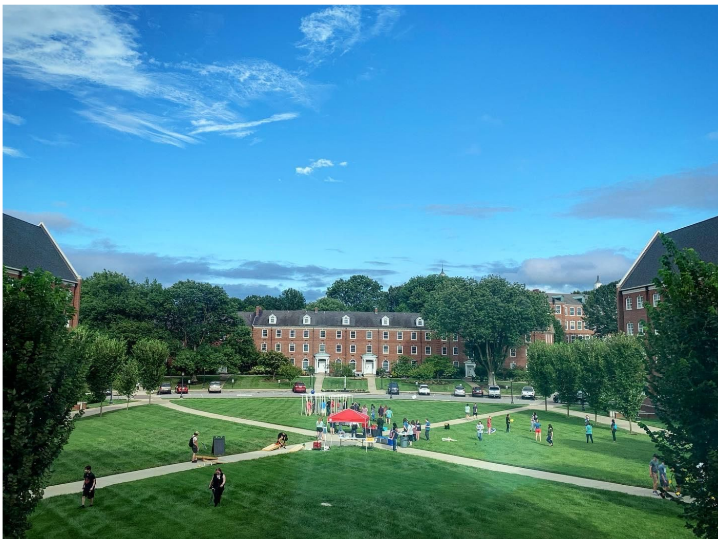
Campus de l'Université