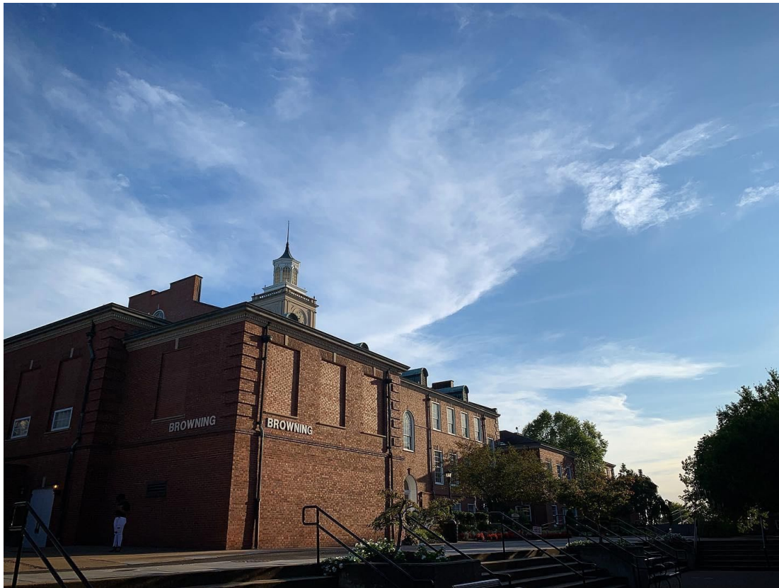
Bâtiment de cours