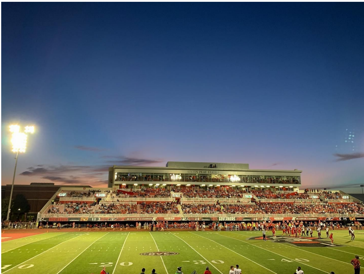
Stade de l'Université