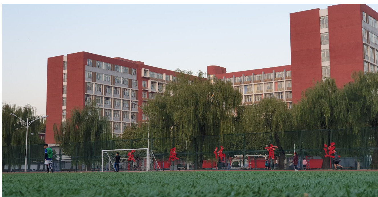
Dortoir des filles chinoises vue du stade de football