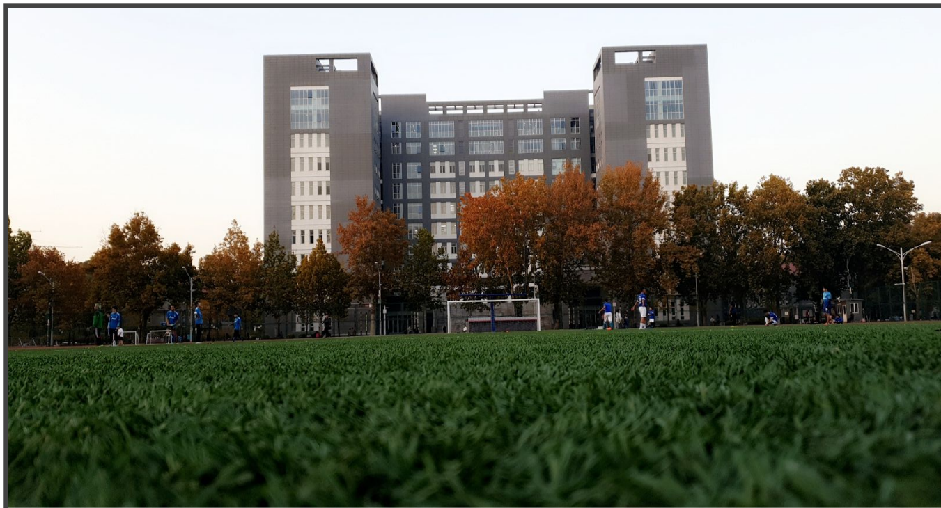
Qiushi building, bâtiment des cours vue du stade.