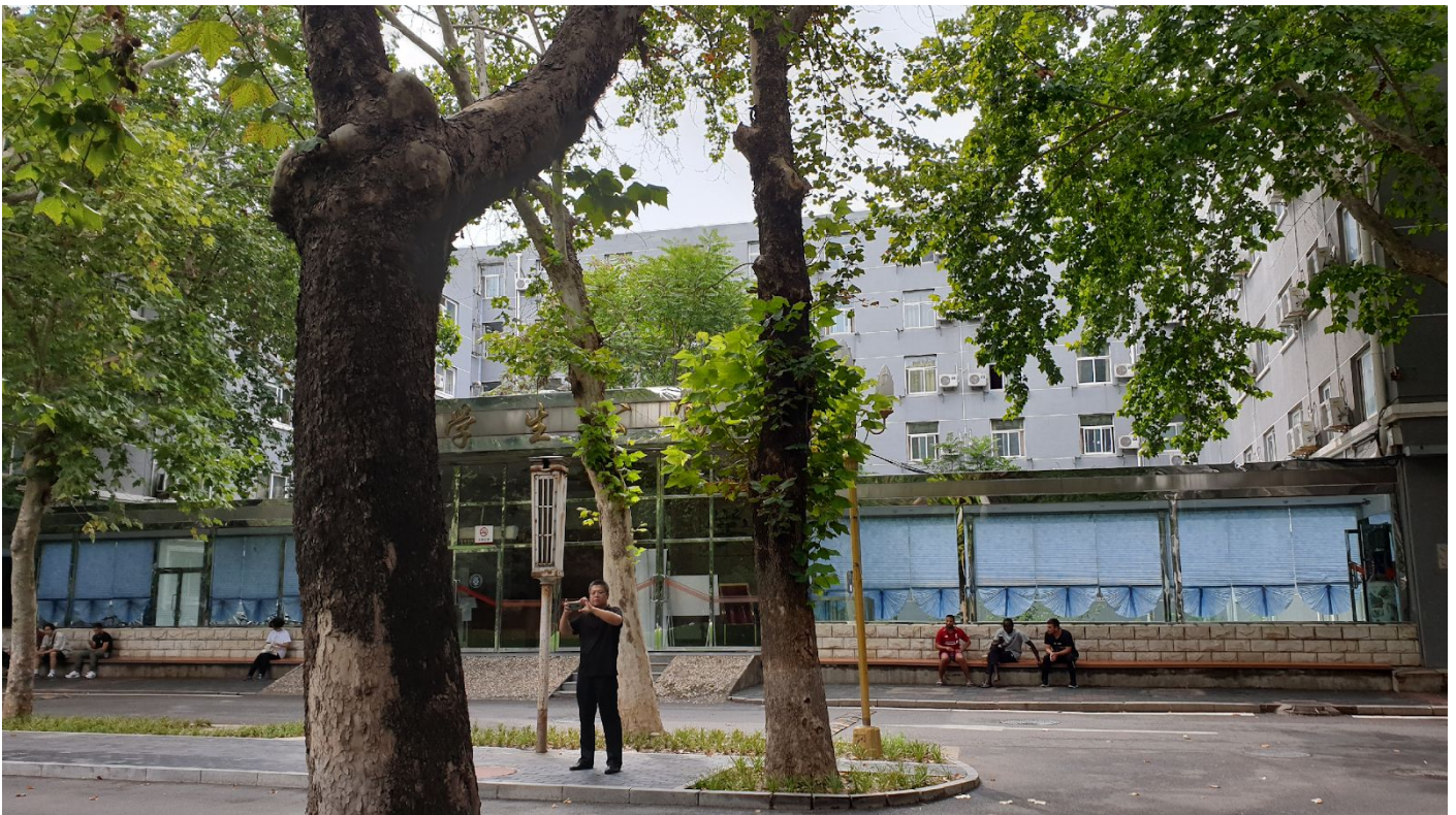
Dortoir étudiants étrangers.

Cependant les candidats désirant vivre en dehors de l'université peuvent le faire en louant un appartement, pour ça les procédures administratives sont différentes.