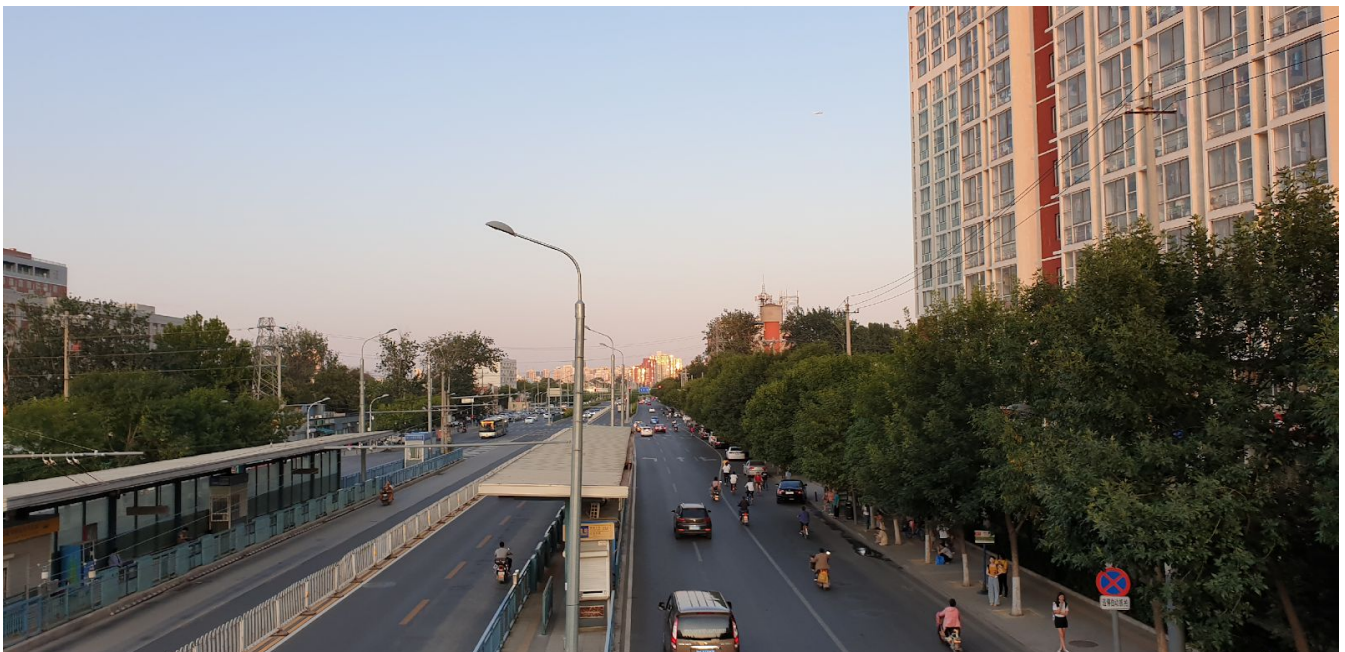
Vue à l'opposé du McDonald

Le campus est très bien organisé et très beau. Il y'a plusieurs cantines, restaurants (coréen, japonais, type Européen), un complexe sportif, des supérettes , des cafés, un musée historique, une salle de Cinéma et beaucoup de bâtiments servant de dortoir pour les étudiants.