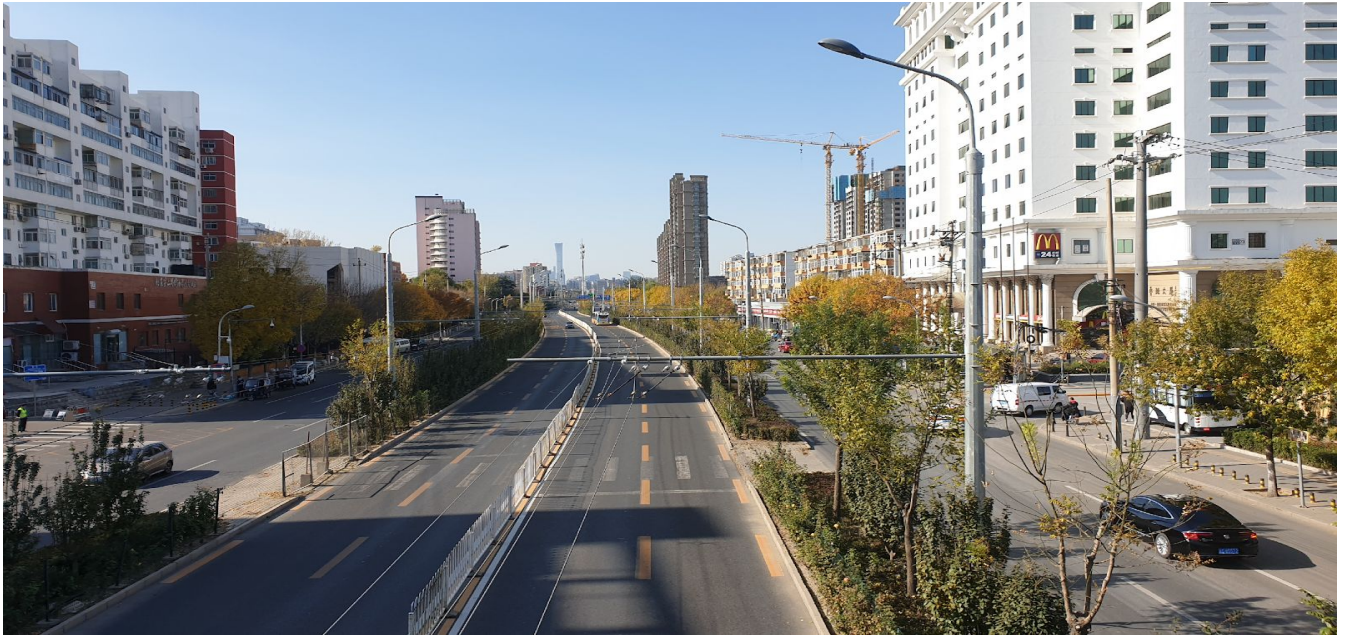
McDonald à droite sur le bâtiment blanc.