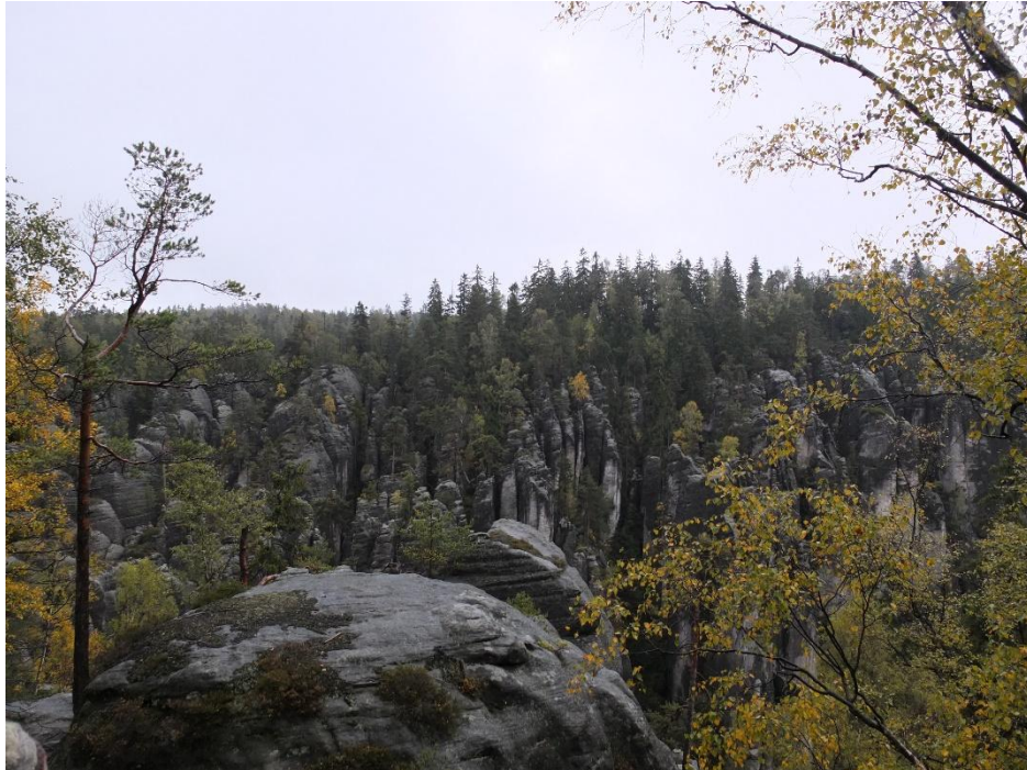
Adršpach-Teplička Rocks, République Tchèque (Randonnée d'une journée proposée par l'association de l'université spécialement pour les étudiants étrangers).