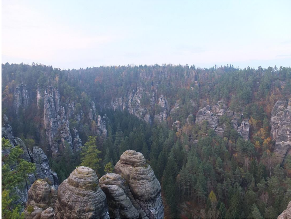
Bastei, Allemagne (randonnée près de Dresden, ville où j'ai pu visiter le musée d'Art : Gemaldegalerie Alte Meister, et la Bibliothèque d'État et universitaire de Saxe)