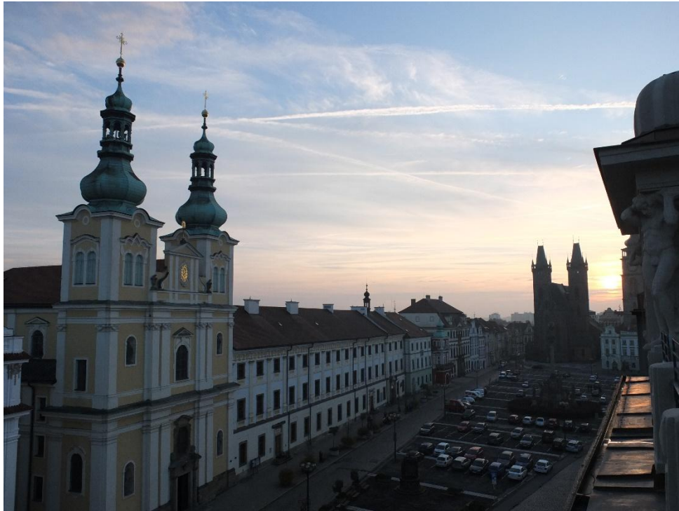
Hradec Kralové, République Tchèque (place centrale vue depuis la Galerie d'Art Moderne).