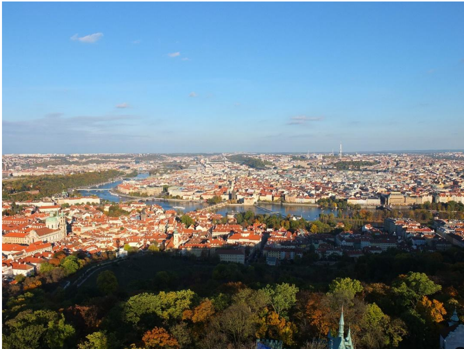
Prague, République Tchèque (vue sur la longue rivière Vltava (affluent de l'Elbe) depuis la Tour de Pétrin, on y entraperçoit le Pont Charles).