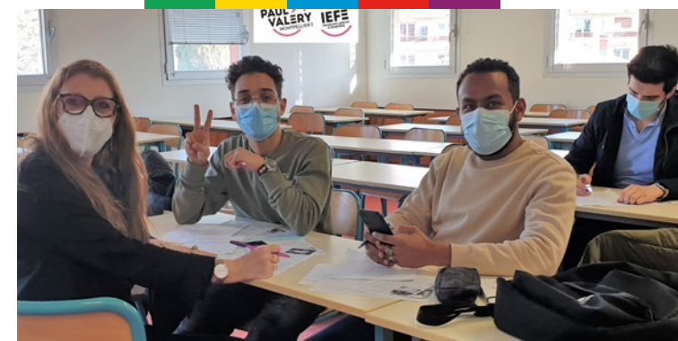
Lors d'un atelier d'écriture.