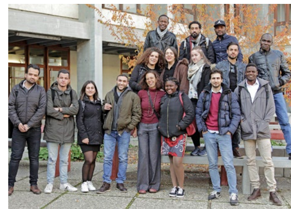
Promotion DU Pass (2018-2019).

Depuis l'ouverture du D.U. Passerelle – Étudiants en exil au CUEF (UGA) en 2015, la formation a accueilli plus de 100 étudiants, venus de 17 pays différents. La maquette du diplôme a évolué pour mieux préparer les étudiants à l'insertion universitaire et professionnelle visée par cette formation, en conformité avec la maquette nationale. La dernière modification a permis de gagner en souplesse et de diversifier les profils d'étudiants : le diplôme a été semestrialisé, afin de limiter les sorties de parcours sans diplôme pour des étudiants parfois contraints de modifier leur projet face à de multiples obstacles administratifs et financiers, et d'accueillir éventuellement de nouveaux étudiants en janvier. Par ailleurs, la mutualisation des cours de langue avec les autres étudiants de DUEF a permis d'intégrer des étudiants de niveau C1 (2 étudiants ce semestre), tout en maintenant un socle de cours spécifiques