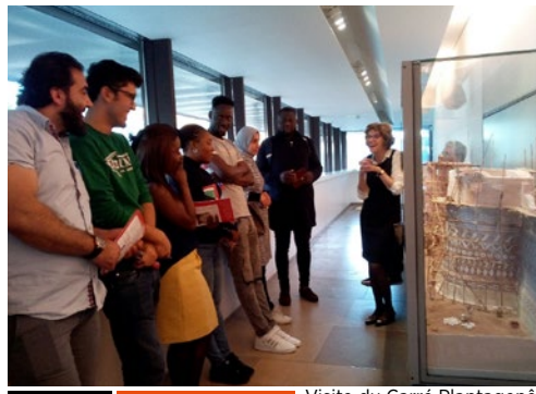
Visite du Carré Plantagenêt.