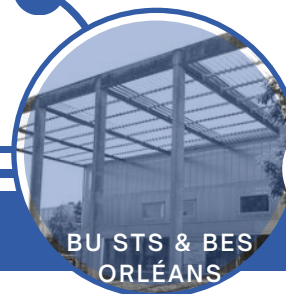
BU STS & BES ORLÉANS