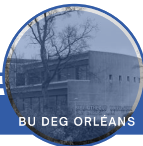
BU DEG ORLÉANS