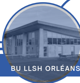
BU LLSH ORLÉANS