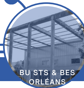
BU STS & BES ORLÉANS