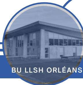
BU LLSH ORLÉANS