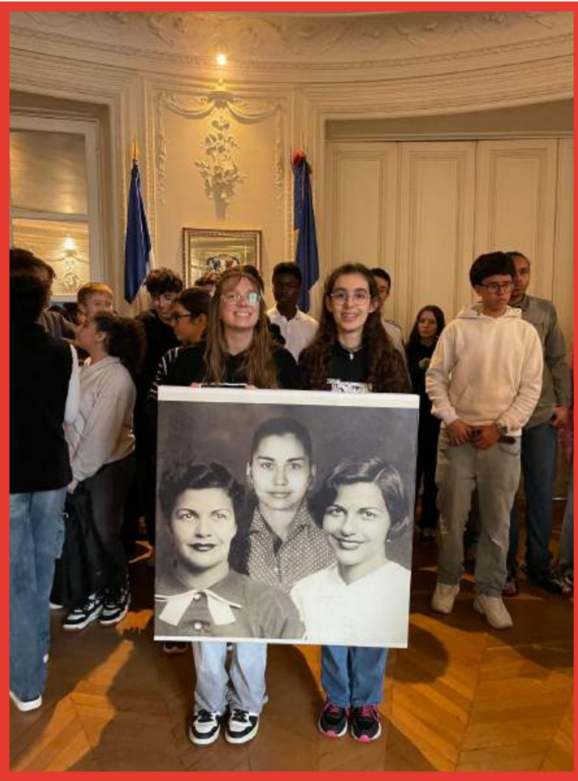
Visite de l'Ambassade de la République Dominicaine à Paris

Participation à des événements organisés par l'Ambassade de République Dominicaine en France