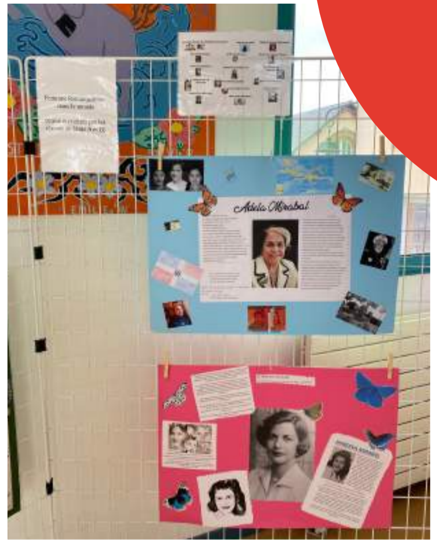
Exposition sur des femmes remarquables dans le monde (les Soeurs Mirabal, la République Dominicaine, en lien avec le cours de Français: travail en interdisciplinarité)