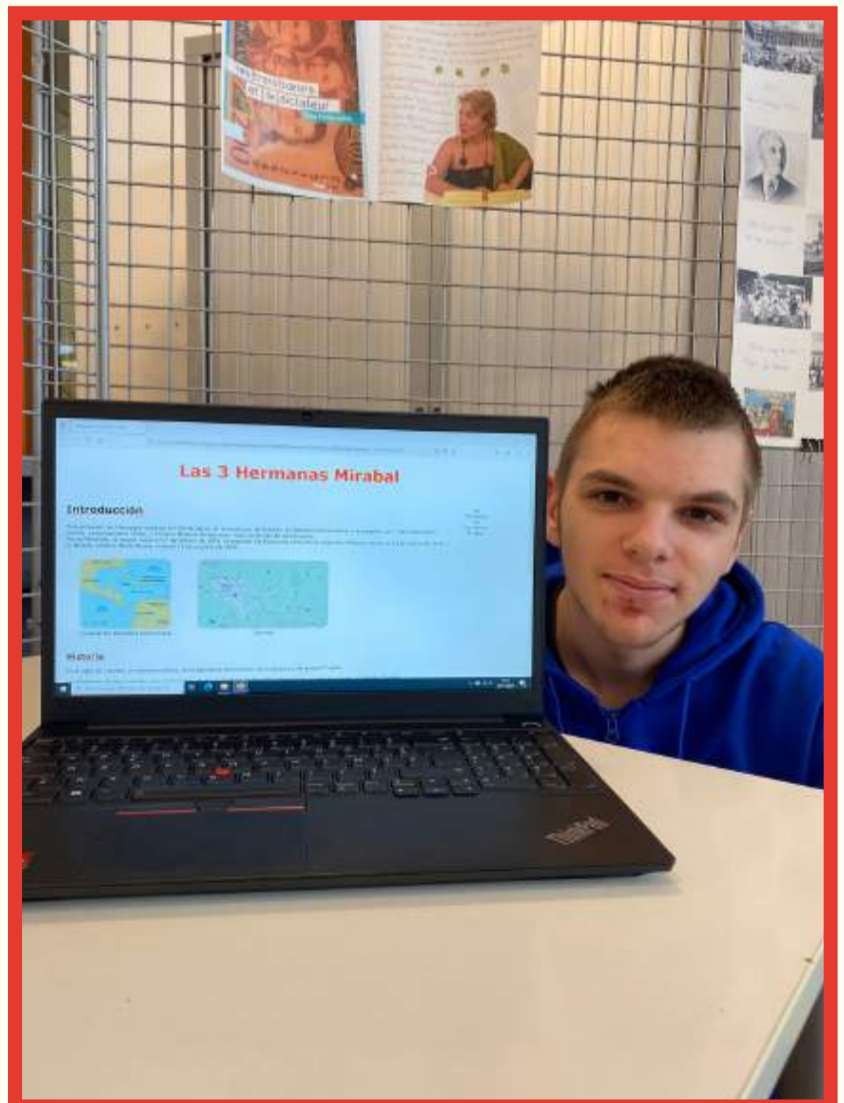
Création d'un site internet interactif