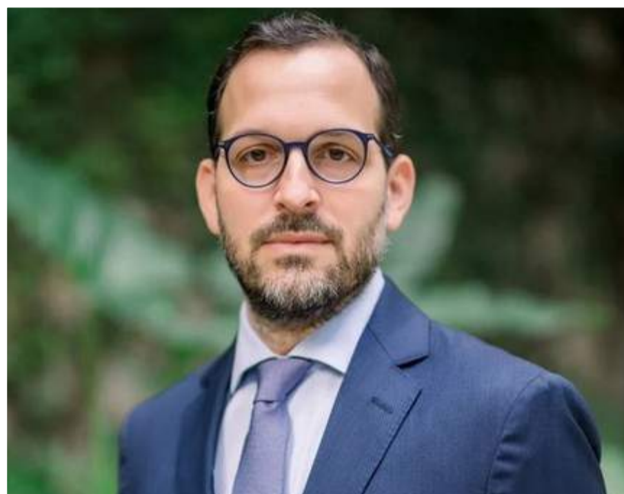
David Puig, Ambassadeur de République Dominicaine en France