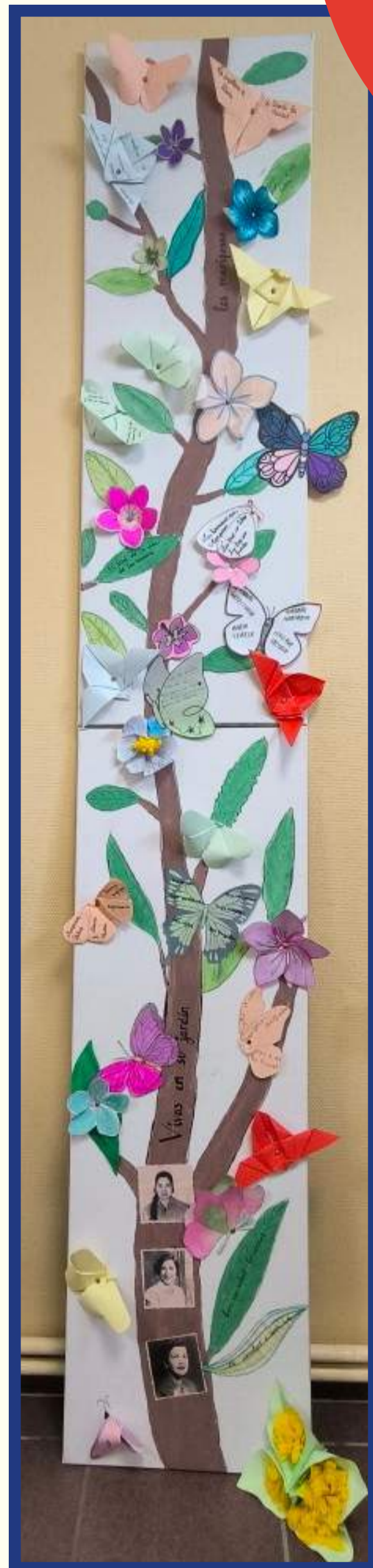
Vivas en su jardín, collages et gouache sur toiles articulées, 240 X 40 cm Envolée de papillons, collages et gouache sur toiles articulées, 160 X 80 cm

Une séquence sur les Sœurs Mirabal a été travaillée en cours d'Espagnol avec un questionnement initial sur la mémoire des sœurs Mirabal comme source d'inspiration dans la lutte contre les violences faites aux femmes. Un travail de lecture de l'œuvre d'Élise FONTENAILLE, Les trois Sœurs et le dictateur a été réalisé en cours en Français. Un travail commun a été ensuite été mené, en co-animation et sur plusieurs séances, pour la réalisation des œuvres. Les élèves ont pu réactiver et mettre en relation les acquis des cours de Français et d'Espagnol pour aboutir à la création de deux œuvres collectives mêlant de courts textes poétiques rédigés selon plusieurs modalités en Français et en Espagnol, et des réalisations plastiques afin d'exprimer leurs ressentis et leurs émotions face à la lutte de ces femmes inspirantes.