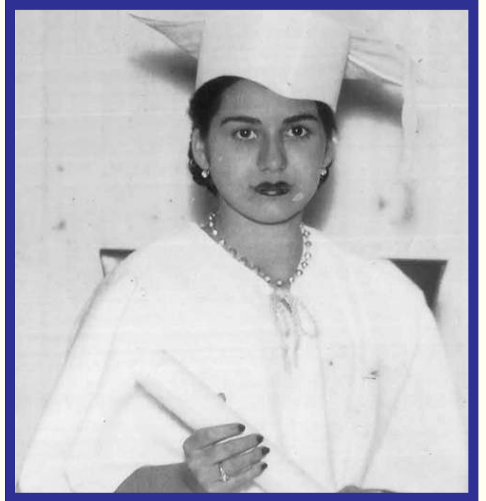
María Teresa Mirabal lors de la cérémonie de remise du baccalauréat en 1953